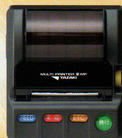
新計量法印字は マルチプリンタⅣ(別売)で行えます。

システム・タクシー用タコグラフ機能 内蔵により情報のデータ化を実現。 業務効率アップで経費を削減。